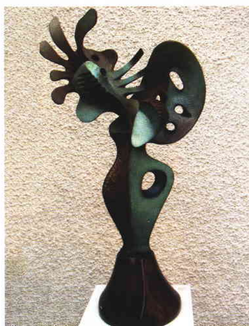
"Vase en fleurs"

référence au réel s'inscrit dans une gamme chromatique étonnamment diversifiée pour des œuvres sculptées. L'œuvre de Viktor Mikhailov se situe ainsi à la frontière de plusieurs conceptions et interprétations esthétiques. Elle s'affirme comme l'ossature d'une réalité que l'artiste suggère plus qu'il ne la représente.