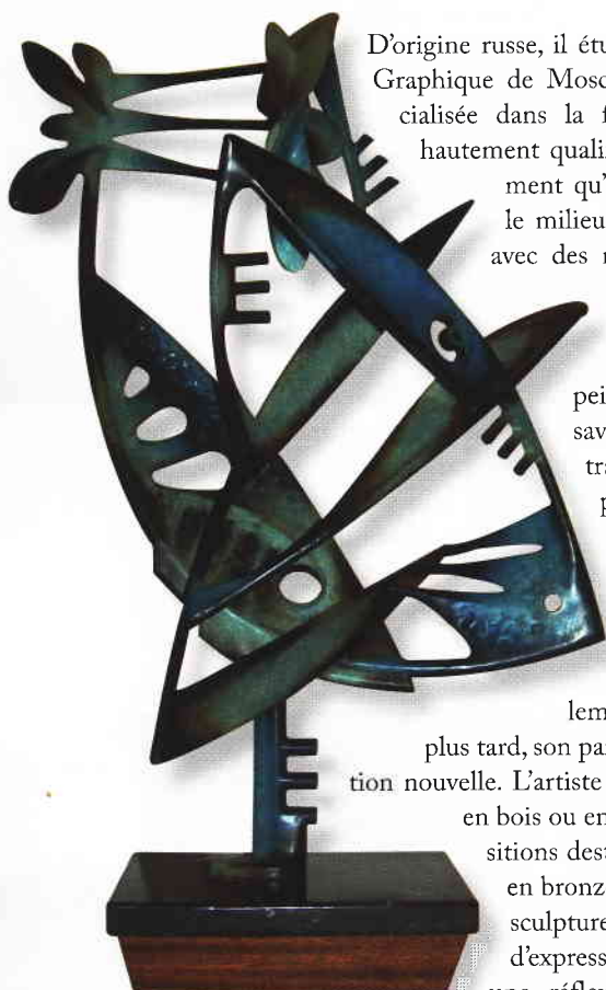
"Chasse aux orchidées"